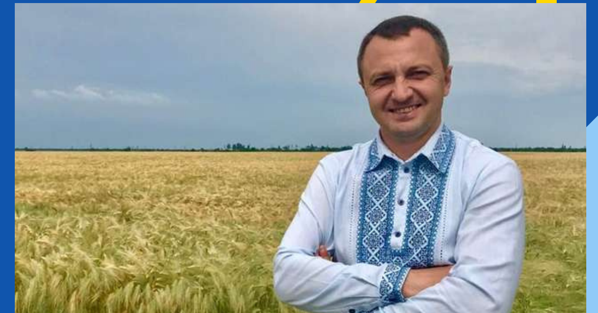
МОВНИЙ ОМБУДСМЕН ТАРАС КРЕМІНЬ