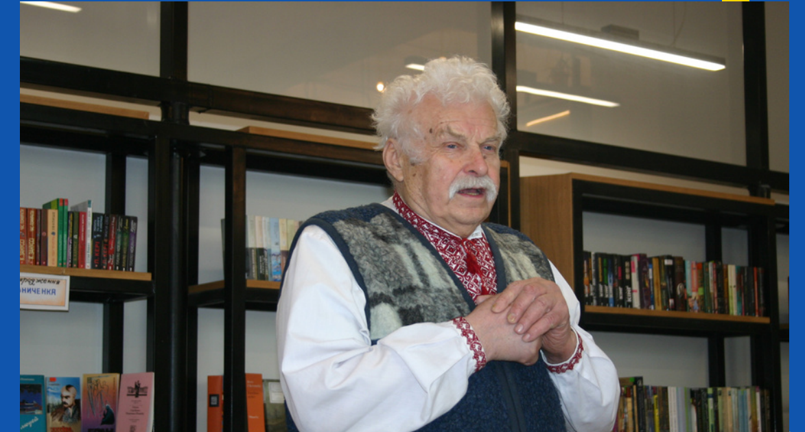
ПИСЬМЕННИК, ДИСИДЕНТ ОЛЕКСА РІЗНИКІВ