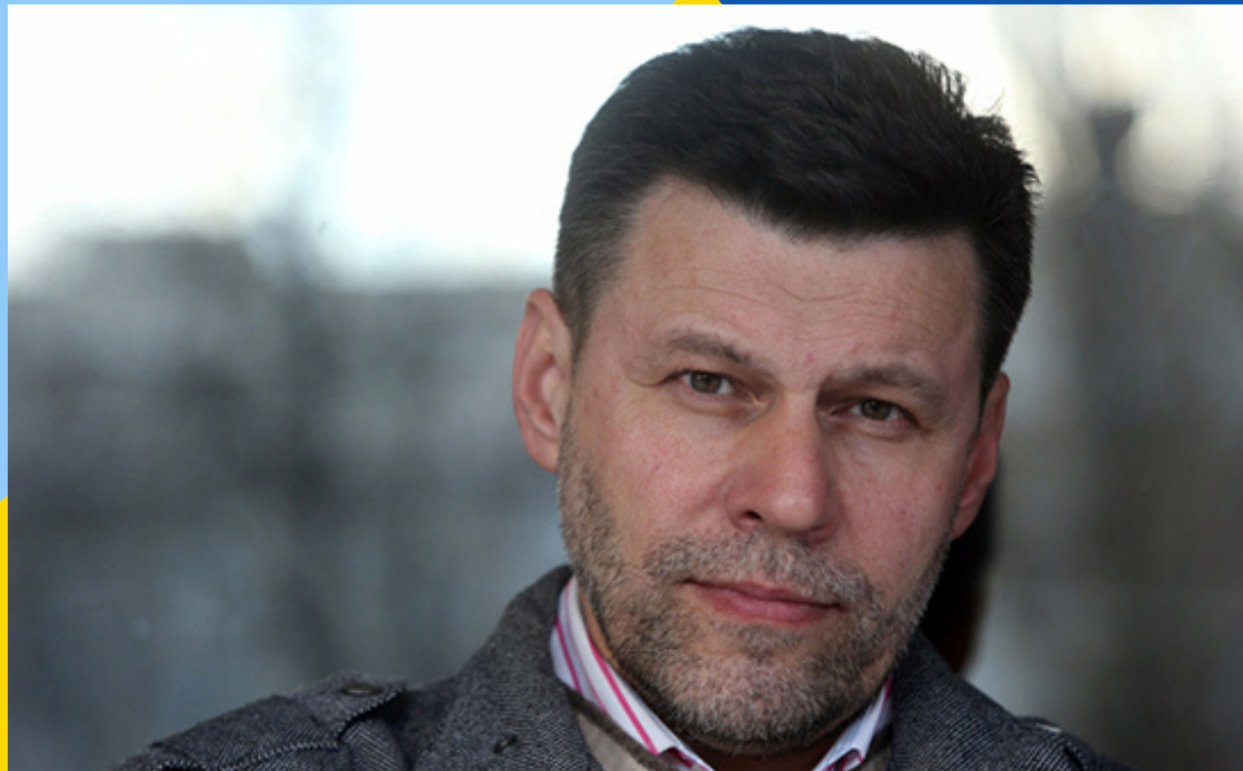
ПИСЬМЕННИК ПАВЛО ВОЛЬВАЧ